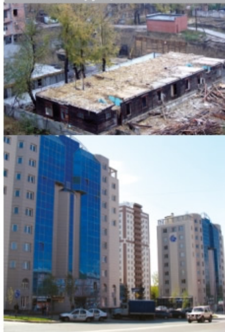
Реконструкция: до и после